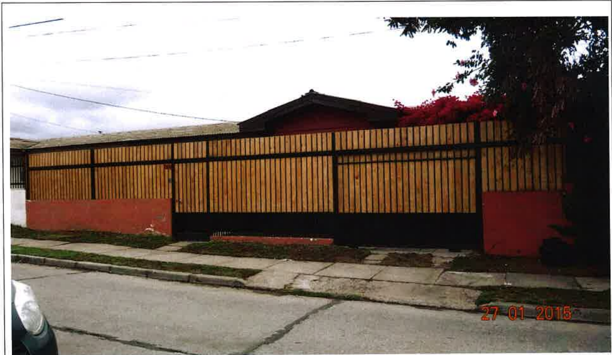
Fotografía N°2. Fachada de la Residencia Familiar Hatary, ubicada en calle República N° 765, La Serena.