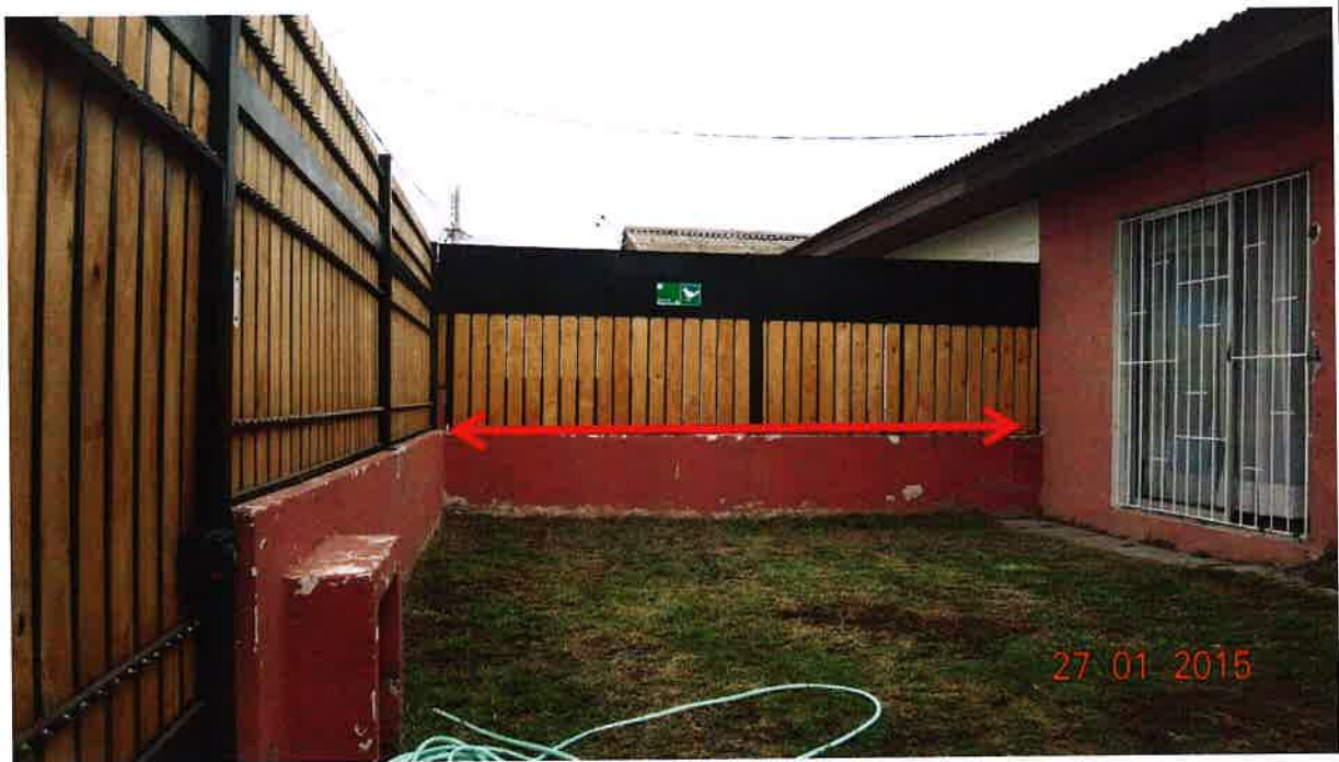
Fotografía N° 3. Cierro del medianero del antejardín.